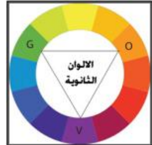
شكل رقم (٤) الألوان الثانوية