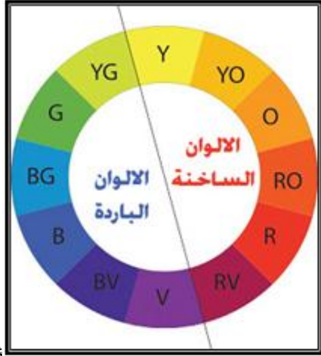
شكل رقم (٧)

الألوان الساخنة والباردة وتأثيراتها الألوان الساخنة تتضمن الأحمر والأصفر والبرتقالي وقد سميت بذلك لأنها تذكرنا بألوان النار والدم، وهي مصدر للدفيء أما الألوان الباردة تتضمن الأزرق والأخضر والبنفسجي، وقد سميت بذلك لأنها تتفق مع السماء والماء وهما مبعث البرودة، ومن أهم التأثيرات للألوان الباردة والساخنة إنها تلعب دورا كبيرا في الإحساس بالعمق فالألوان الساخنة تظهر أقرب إلي المشاهد وأكثر تقدما من الألوان الباردة. شكل رقم ٧