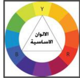
شكل رقم (٣) الألوان الأساسية

ومن أنواع الألوان ما يلي الألوان الأساسية: وهي أصل الألوان وهي ( أحمر – أزرق – أصفر ) وسميت بذلك لأنه لا يمكن استخراجها من الألوان الأخرى. شكل رقم ٣ الألوان الثانوية: نحصل عليها إذا مزجنا لونين أصليين بنسبة متساوية فينتج لون ثالث هو ما نطلق عليه لون ثان أو ثانوي ولهذا الطريقة نحصل على ثلاثة ألوان ثنائية هي (الأخضر – البنفسجي – البرتقالي) والألوان الأساسية مع الألوان الثنائية هي الألوان التي يطلق عليه الألوان القياسية. شكل رقم ٤ الألوان المحايدة: الألوان المحايدة أو المحايدة هي الأبيض والأسود والرماديات العديدة التي قد تستنتج من مزج الألوان الأساسية الثلاثة ويهتم الفنان والمصمم بالألوان المحايدة اهتمام بالغ مثل اهتمامها بباقي الألوان الأخرى فالألوان المحايدة تعالج كثير من المشاكل الفنية في التكوين أو التصميم حيث أن خواصها تتمثل في. شكل رقم ٥ أنها غير متواجدة على الدائرة اللونية تعتبر لا لون لها دائما تتوافق مع أي مجموعة لونية