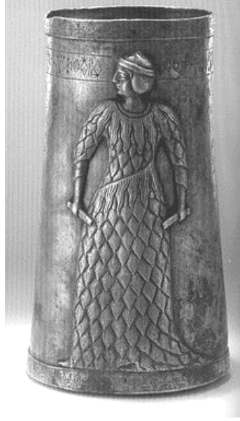
كاس فضية من العصر العيلامي القديم نهاية الالف الثالث ق.م مثل عليها امير عيلامي