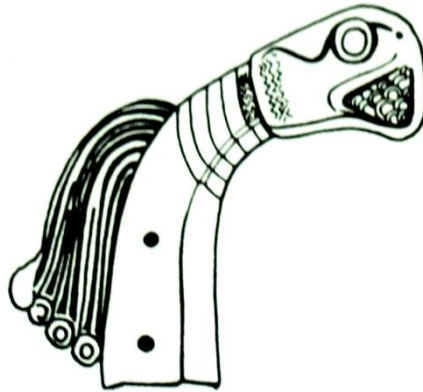
مطرقة نذرية نحاسية من سوسة عيلامي قديم ٢٠٠٠ق.م