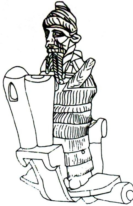
اله عيلامي مصنوع من البرونز على عربة (١٥.٧) سوسة