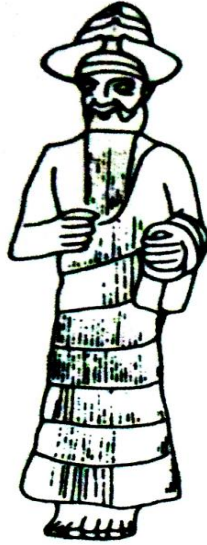
اله عيلامي من الالف ٢ ق.م ٧ اسم برونز مطلي بالذهب سوسة