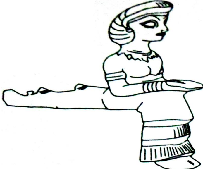
الهة السمك / عيلامي قديم القرن ١٦-١٧ ق.م/برونز/١٢سم